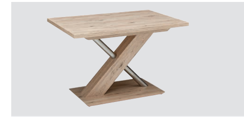
Jídelní stůl DUO 200

Rozměry: 110 x 70 cm, 120 x 80 cm, 130 x 85 cm Rozměry rozkládacího stolu s vložnou deskou 40 cm: 110 (150) x 70 cm, 120 (160) x 80 cm, 130 (170) x 85 cm