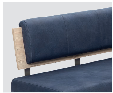
Opěrák typ 2