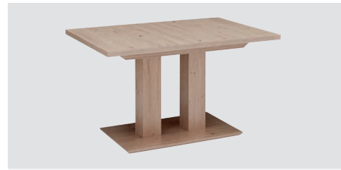
Jídelní stůl Duo 100

Rozměry: 110 x 70 cm, 120 x 80 cm, 130 x 85 cm Rozměry rozkládacího stolu s vložnou deskou 40 cm: 110 (150) x 70 cm, 120 (160) x 80 cm, 130 (170) x 85 cm