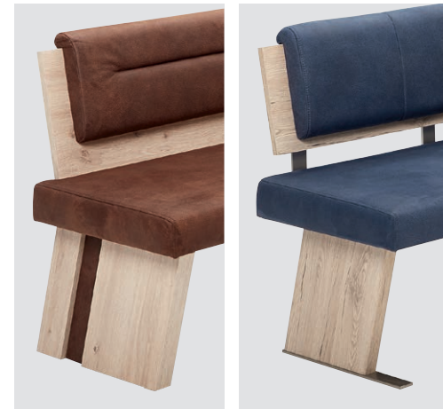
Bok typ A Bok typ B